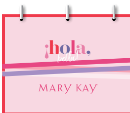
Frente a tu audiencia