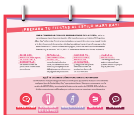
Frente a ti